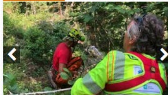
Onore, precipita mentre taglia delle piante e muore